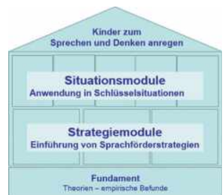
Abb. 1: Überblick über das Qualifizierungskonzept »Mit Kindern im Gespräch« (Kammermeyer et al., 2017b, S. 8).

Modellierungsstrategien dienen darüber hinaus dazu, Kindern das komplexe System Sprache in vereinfachter Form zu präsentieren, so dass Kinder es aufnehmen und verarbeiten können (u.a. Weinert & Grimm, 2012).