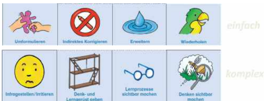
Abb. 4: Rückmeldestrategien im Überblick (Kammermeyer et al., 2017b, S. 28 ff.).

hat (Lipowsky, 2010, 2014), wird die Methode des Situiereten Lernens gezielt eingesetzt. Das heißt, es werden folgende Erarbeitungsmethoden in der Qualifizierung genutzt (vgl. Hartinger et al., 2011; Kammermeyer et al., 2017b, S. 41 ff.):