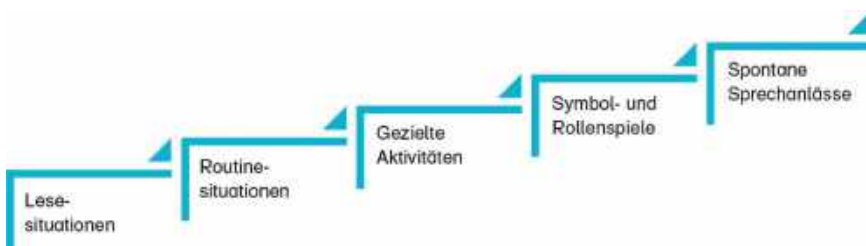
Abb. 5: Stufenartiger Aufbau der Schlüsselsituationen (Kammermeyer et al., 2017b, S. 32).